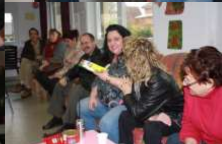
Bouchées à la Reine et le traditionnel HopHopHop (quizz) pour un dimanche convivial