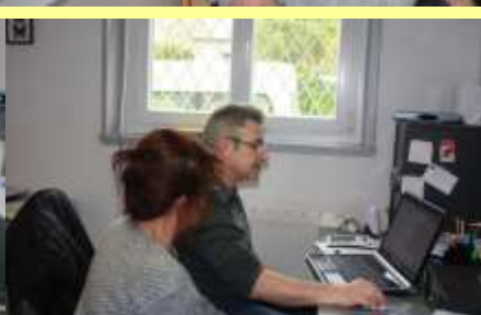
Un GEM plein à craquer lors de l'Assemblée Générale 2013 !