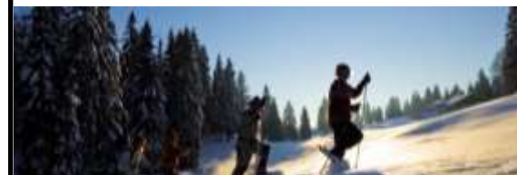
Rando raquettes dans le Jura 06 au 11 Mars 2017