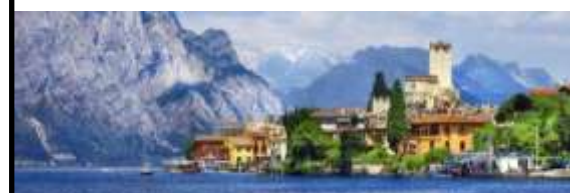
Lago di Garda – Italie 18 au 23 Juin 2017