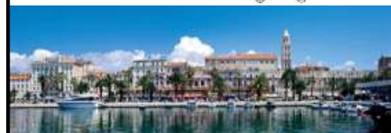
Split - Croatie Juin 2017