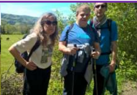
Passage par la ferme aux lamas du Hornihof