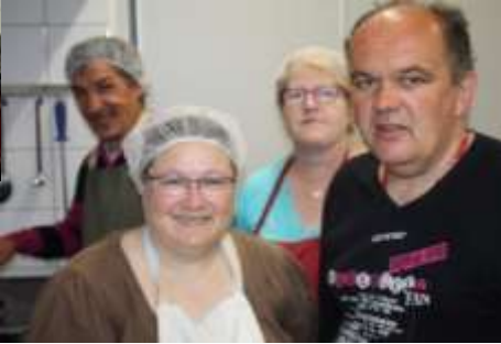
Jeudi 18 mai : Dhal de lentilles corail et Tapioca coco/fruits secs