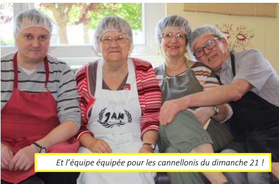
Et l'équipe équipée pour les cannellonis du dimanche 21 !