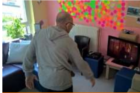
Après-midi Kinect pour s'amuser malgré la pluie !