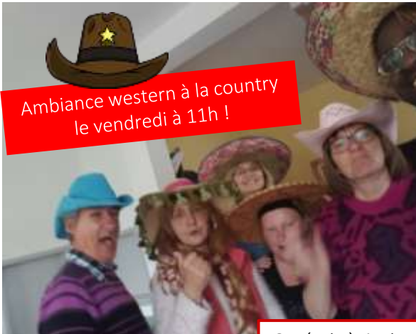
Ambiance western à la country le vendredi à 11h !