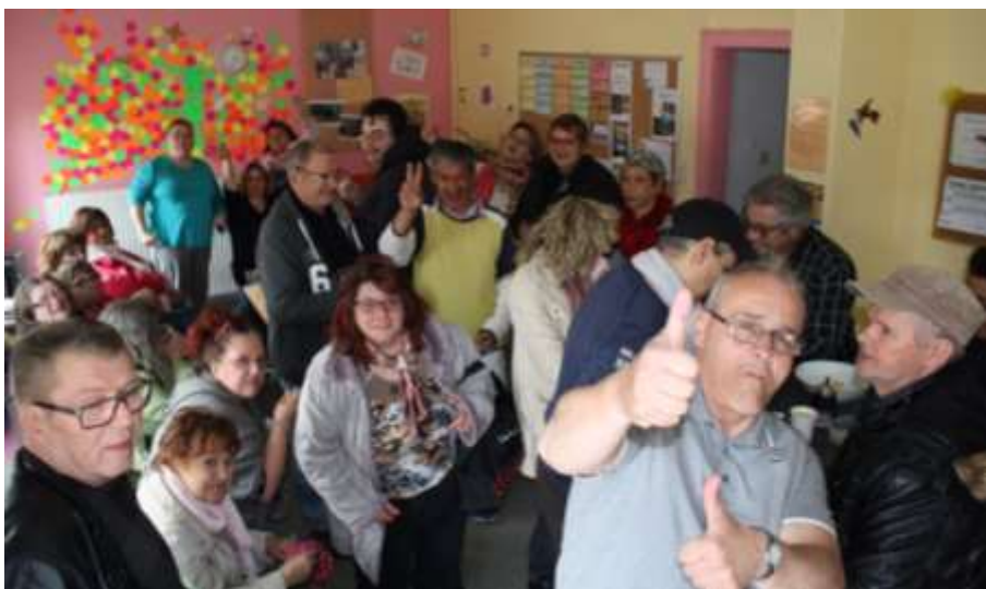
Le GEM bien rempli lors de l'Assemblée Générale vendredi 28 avril ! Merci à tous pour votre présence et votre investissement dans l'association !