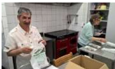
Tri des fromages du Jura pour honorer toutes les commandes !

Je remercie le GEM de m'avoir donné une chance, de faire toutes sortes d'activités, ça m'a permis d'avancer. Ça m'a fait plaisir de reprendre des activités, avec les gens, avec la bonne humeur et être bien avec soi-même et les autres.