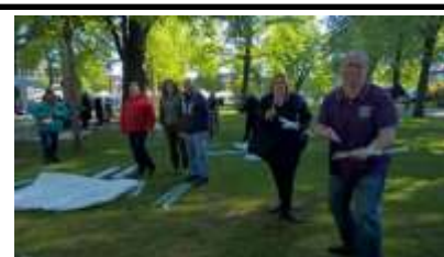
Samedi 9h30 : Le stress annuel avant le montage des tentes...