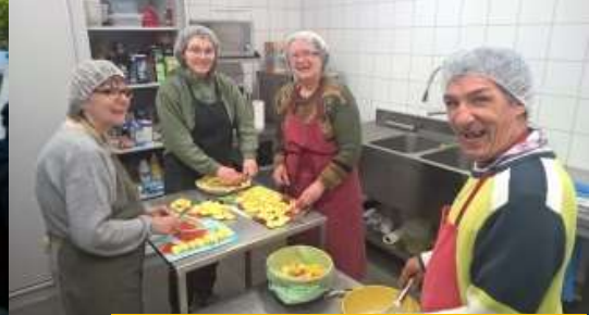
La préparation des tartes pour le festival