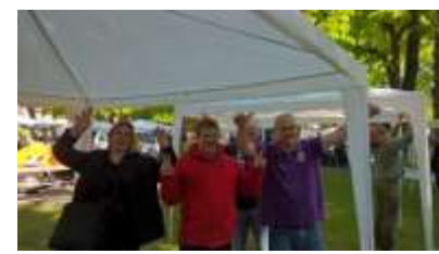
Samedi 9h48 : Soulagement, les tentes sont montées !