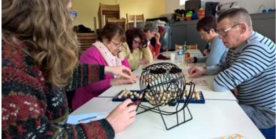
Public concentré lors du Loto de Pâques !