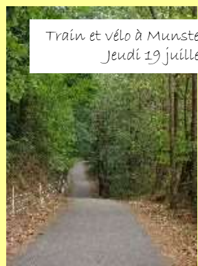
Train et vélo à Munster Jeudi 19 juillet