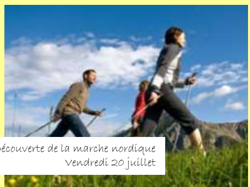
Découverte de la marche nordique Vendredi 20 juillet