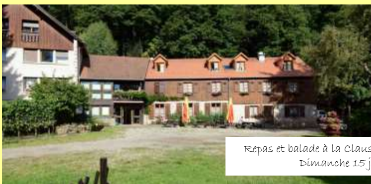
Repas et balade à la Clausmatt Dimanche 15 juillet