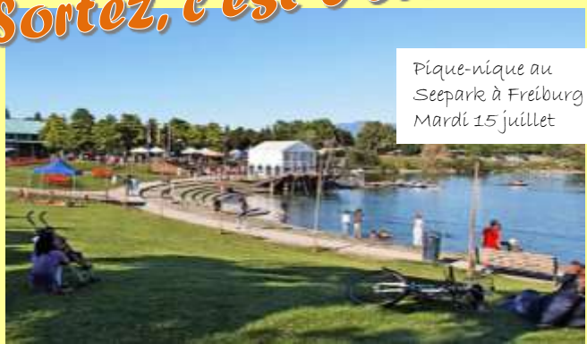
Pique-nique au Seepark à Freiburg Mardi 15 juillet