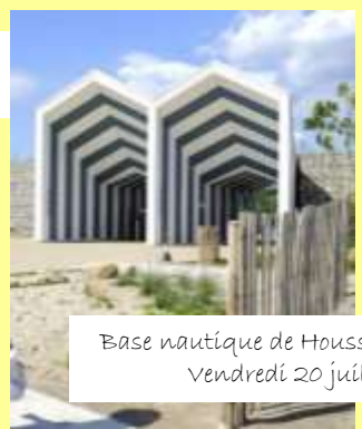
Base nautique de Houssen Vendredi 20 juillet