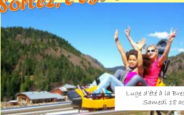
Luge d'été à la Bresse Samedi 18 août