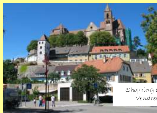
Shopping à Breisach Vendredi 17 août