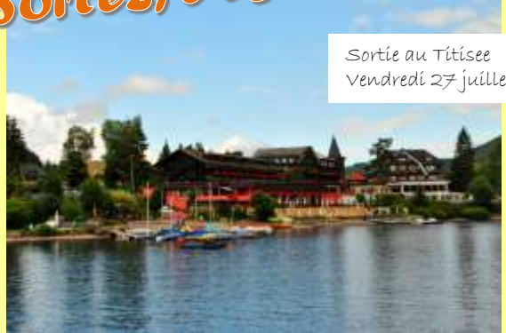
Sortie au Titisee Vendredi 27 juillet