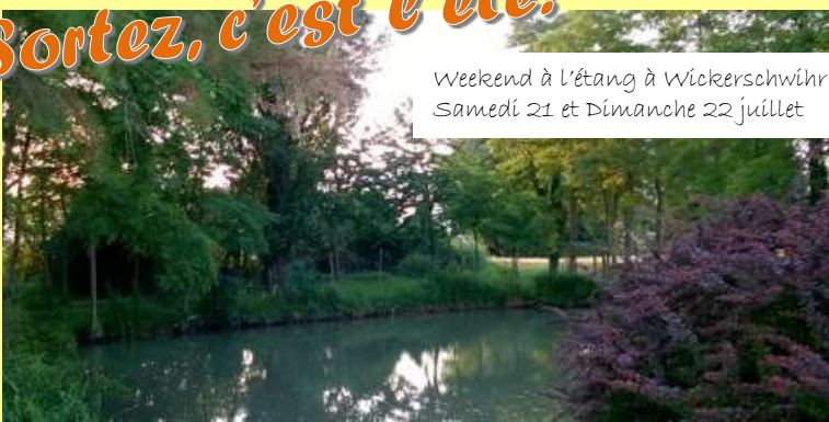
Weekend à l'étang à Wickerschwihr Samedi 21 et Dimanche 22 juillet