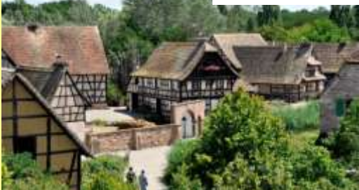
Ecomusée Vendredi 13 juillet