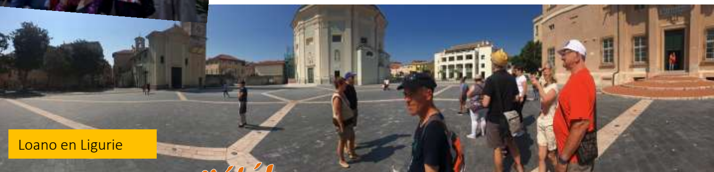
Loano en Ligurie

Les autres sont allés faire les boutiques à Loano et Michel est allé à la pêche. Certains sont descendus au front de mer pour boire un verre.