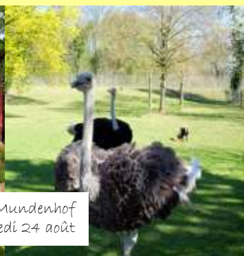
Sortie au Mundenhof Vendredi 24 août