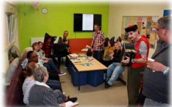
Les coiffes alsacienne sont de de sorties !