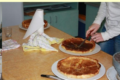
De bonnes choses à déguster et le plein de sourires lors des repas du dimanche !