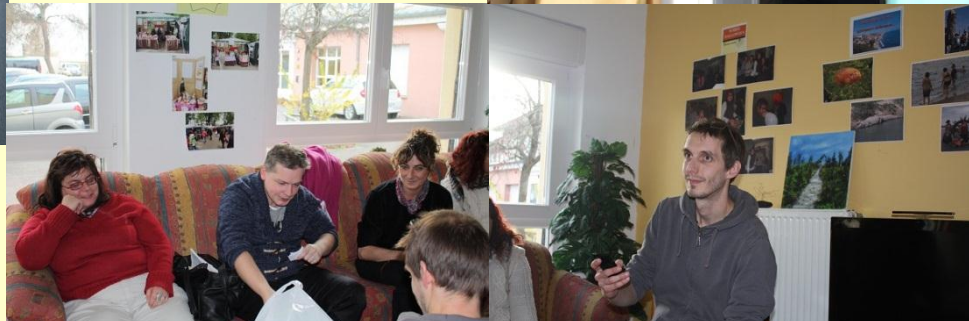
Jeu de devinettes et de mimes lors du Time's Up ! Félicitations aux gagnants ;)