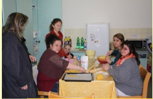
Préparation de gâteaux de Noël en compagnie de nombreux goûteurs...