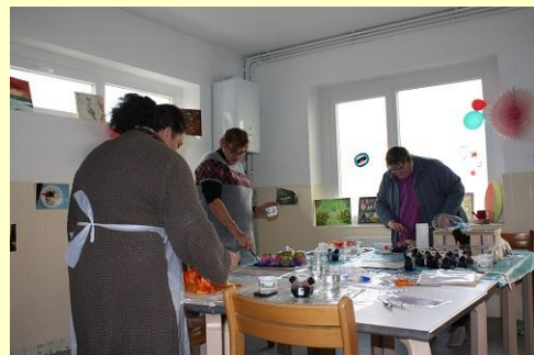
Réalisation de foulards lors de l'atelier peinture sur soie