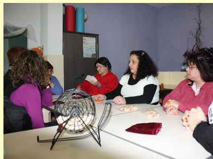
Loto, concours de belote... toujours des gagnants au GEM !