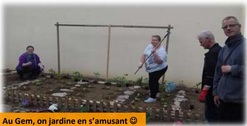
Au Gem, on jardine en s'amusant ☺