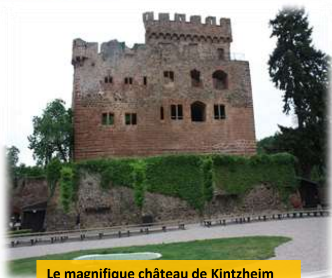
Le magnifique château de Kintzheim