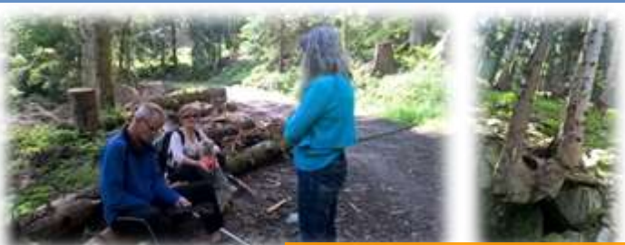
Les cascades de Stosswihr