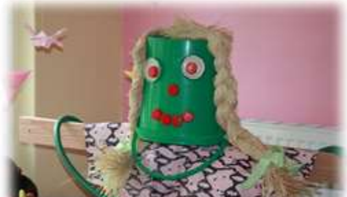
Surprenant épouvantail !