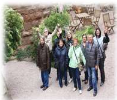
Une nouvelle espèce d'oiseau 😊 !